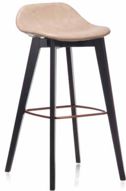
COUNTER CHAIR H65 — C0526