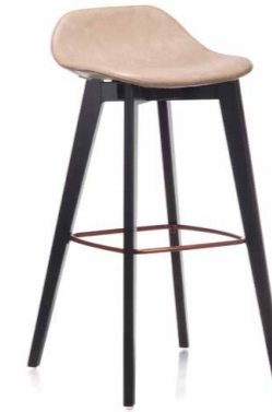
COUNTER CHAIR H65 — C0526